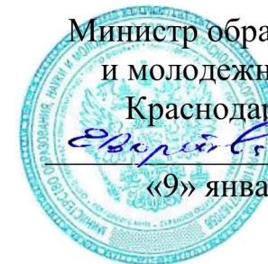
ГРАФИК проведения краевых родительских собраний на 2025 год